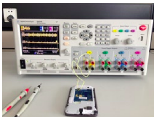
关机与休眠电流测试