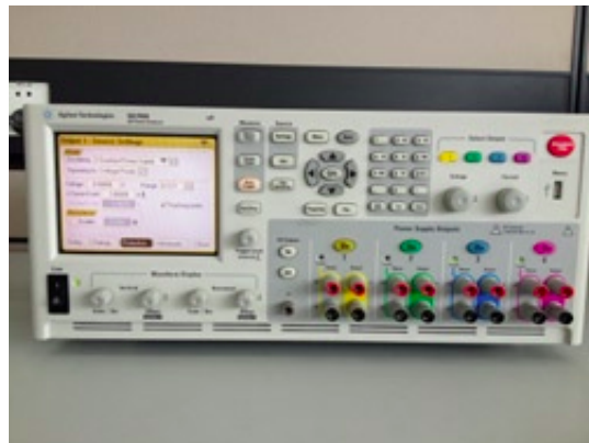
安捷伦直流电源分析仪N6705B

展讯SC8825采用双核1.2 GHz Cortex-A5 CPU，集成双核Mail-400的GPU。外部需要搭配SR3500收发器，以及SC2712 ABB两颗芯片。而从框图中可以看出，在SC8825是一款支持TD-SCDMA和GSM的双模芯片。其内部集成了300MHz的ARM926和CEVA X1622的DSP来处理Baseband的工作。其最大支持1280x720 HD分辨率的LCD和8M的Camera。